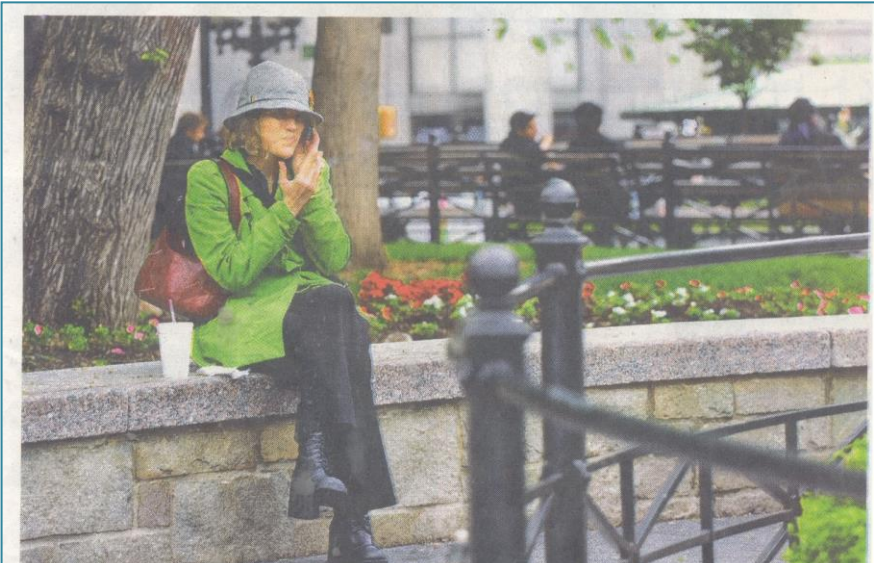
מעשנת ביוניון סקוור. מחיר הפיסת סיגריות בניו יורק יכול להגיע ל-15 דולר

העבריינים יקבלו קנסות בין 50 ל-250 דולר. יש להניח שאי יריעת החוק לא תפטר את התיירים מעונש, למרות שהחלקם יכולים לקות שלמשהו אין מספיק כוח אדם לתפוס כל מע" שן ברחובות העיר המונה כמעט 19 מיליון תושבים. ניו יורק מתהדרת בכ-22 ק"י