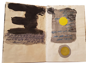
מיכאל בן אבו