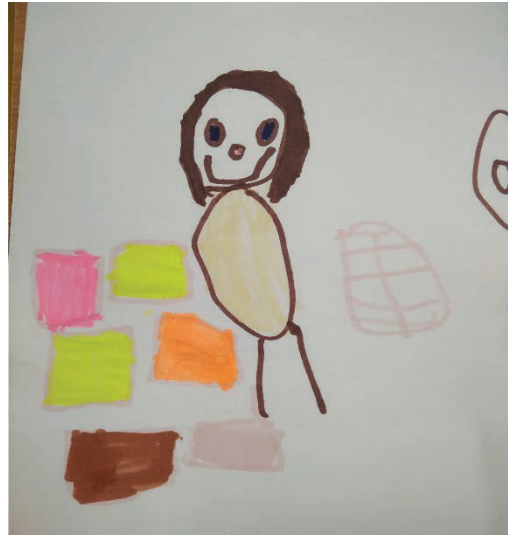
נועם: "אימא שלי מכינה סנדוויצ'ים. היא עובדת בקיוסק"