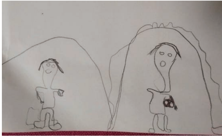
איתן: (מצייר במהירות ילד עצוב): הילד עצוב כי הוא צריך לעבוד.