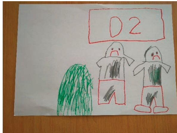
הציור של עמי: גדי ונועה עצובים. הם קיבלו מהשכנה 20 שו. זה לא מספיק לקנות בגדים. אז הם שוב התחבאו מאחורי השיח.