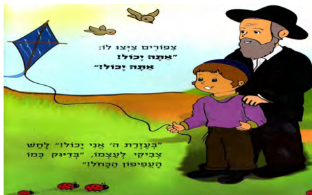
איור מס' 6: העפיפון היכול – ספר חרדי בו מופיעות רק דמויות חרדיות

חילוניות. לדוגמא בסיפור רואים ניסים קיים מסר של קבלת ה"אחר" החילוני. (איורים מס' 6 ו-7).