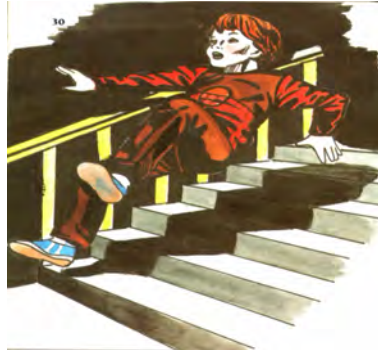
איור מס' 5: ירון מופיע, נופל ומאשים - ולעומת זאת אברהמ'לה מוצג באור חיובי