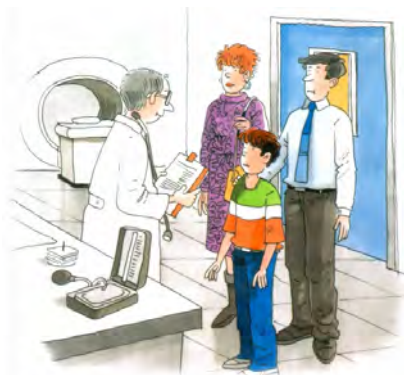
איור מס' 7: רואים ניסים – ספר של חסידות חב"ד: באיור מופיעות דמויות חילוניות – שלא כמו ביתר הספרים החרדיים שסקרתי שבהם מופיעות רק דמויות חרדיות