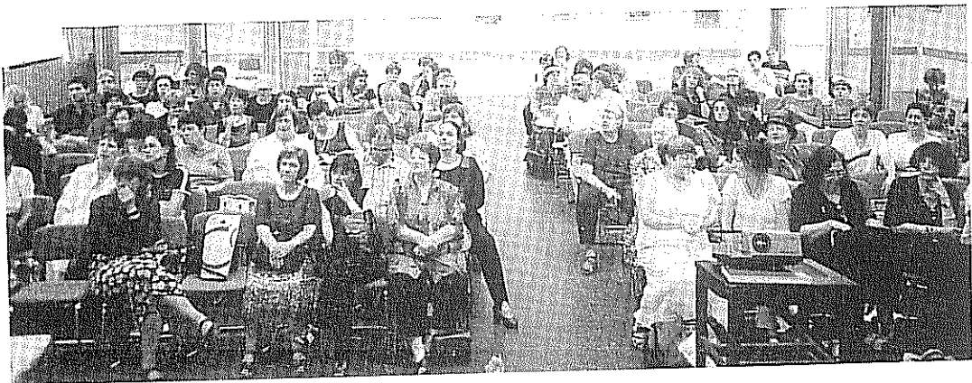
קהל המשתתפים בכנס

אני מאחל לכולם האזנה נעימה. יש כיבוד בהפסקה. בתיאבון!