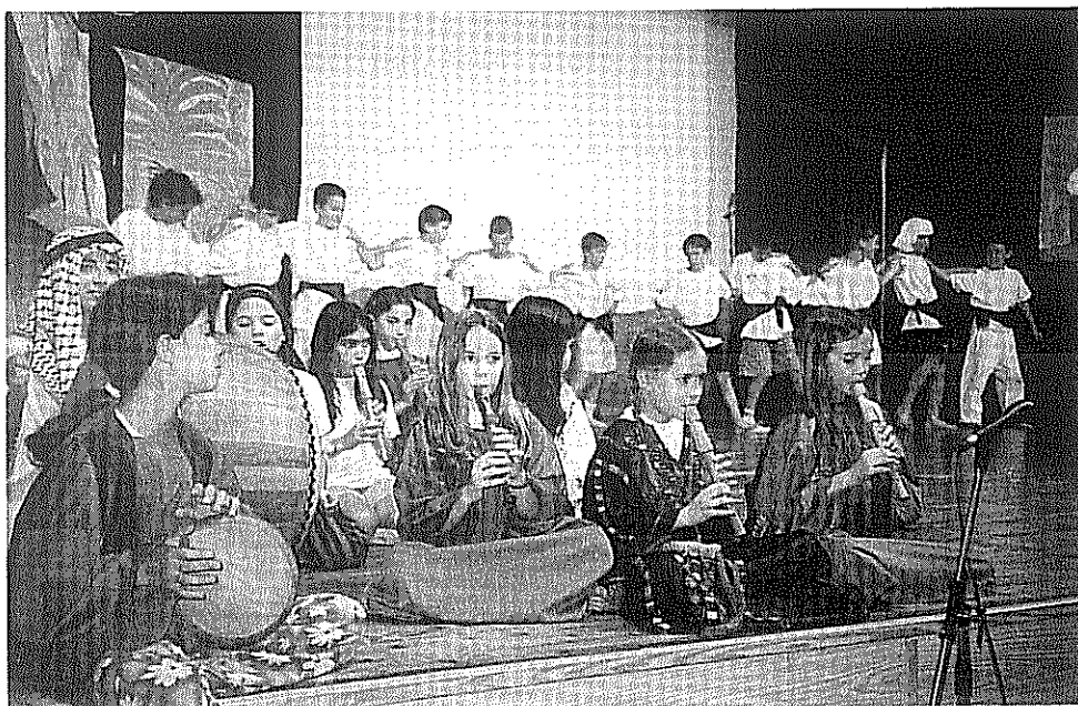
ילדי כיתה ד' בי"ס אדם בהופעה

לא בכדי טען ג'ון דיואי, המחנך והפילוסוף, כי ביה"ס אינו הכנה לחיים, כי אם החיים עצמם.