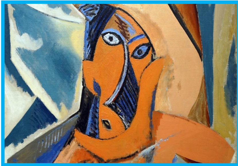
העלמות מאביניון (Les Femmes d'Alger) פאבלו פיקאסו, 1907

ההוראה הקשובה מאפשרת להבנה בכיתה להיות רב ממדית. הבנת התוכן הלימודי אינה מבוססת רק על תפיסת המורה, המייצגת את התפיסה המקובלת בעולם הידע, אלא היא משתלבת בהבנה הנבנית בשיח הכיתתי, המבטאת את עולמותיהם של הלומדים השונים המצויים בכיתה. השיח הכיתתי מהווה בסיס ליצירה של הבנה חד פעמית המערבת את הדרכים השונות להתבוננות בסביבות או בטקסטים רלוונטיים בתהליך ההוראה והלמידה של המושגים הנלמדים. הלומדים הם שותפים פעילים בהוראה ומהווים מתווכים ומשאבי ידע ולמידה לכל השותפים בתהליך, כולל המורה.