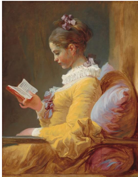
Fragonard, The Reader

הסדנה לחינוך יסודי ועל יסודי, המכללה האקדמית לחינוך על שם דוד ילין